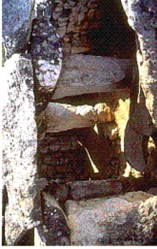
RECINTE DE TAULA